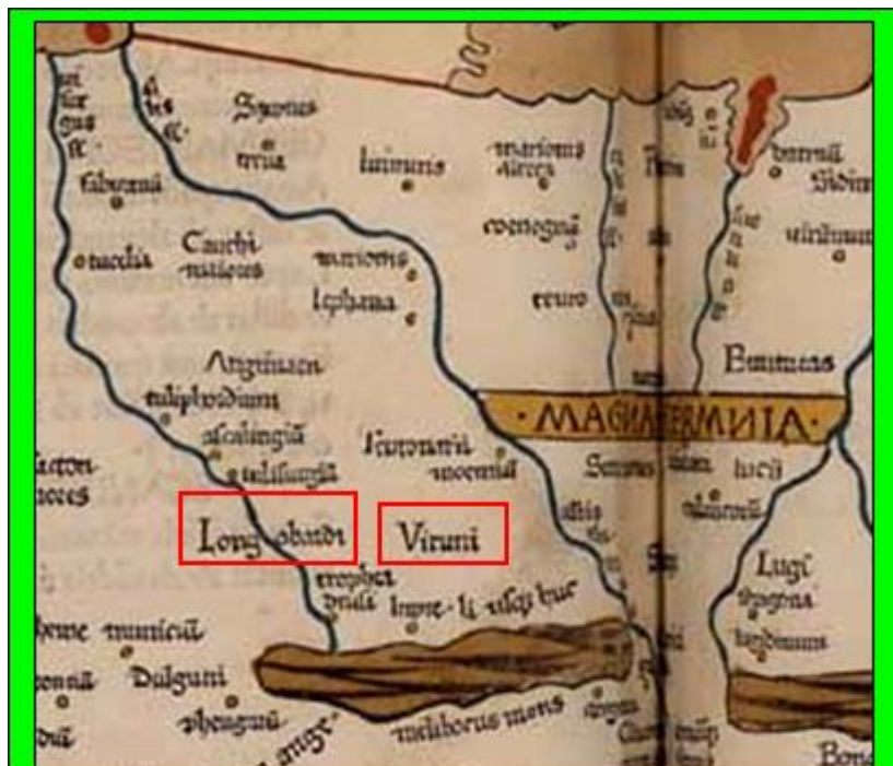
Карта на Сев.Германия по Птолемей, дадени са лангобардите и винилите като обитавачи поречието на Елба.