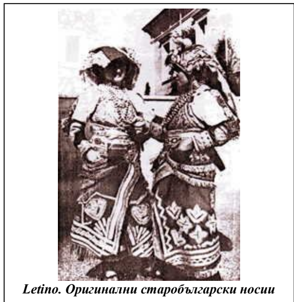
Letino. Оригинални старобългарски носии

победителя, оставайки свързани с аварите от Дакия. По този начин в продължение на 17 години се установяват между лангобарди и българи близки политически, социални и религиозни отношения, както и задълбочено познаване на взаимните способности и недостатъци. Всички завоеватели на Панония, както и на Италия, остават под номиналната зависимост от византийския император, а Константинопол се стреми да разпространи своята религия и култура сред тях.