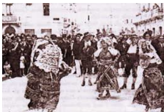
Носии от Letino. Народен танц.

умбрийските Апенини, преодолявайки византийската съпротива и поставят собствена администрация в тези земи. Обсадата на Тичино е продължително, гарнизонът и се съпротивлява храбро и отблъсква лангобардските атаки. В 539 година дизинтерия поваля една трета от франките, дошли да се бият под водачеството на Теодорих - цар на Аустразия (североизточната франкка държава, но Теодорих I умира в 533 г., следователно става дума за сина му Теудеберт I, 533–548 г.), като съюзници на лангобардите. (32). (Ж.В. Теудеберт I е женен за лангобардската принцеса Визигарда, дъщеря на крал Вахо) След три годишна обсада крепостта се предава и става окончателна столица на кралството. Но въпреки стратегическото значение,