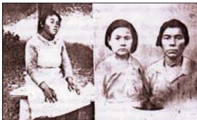
1. Gambatesa(Campobasso). Монголоиден тип брахицефал. 2. Roccasicura(Campobasso). Плоско монголоидно лице.

В светлината на тези сведения нека се опитаме да установим антропологичните данни на българските групи в Италия. През 1879 година военният лекар м-р доктор Родолфо Ливи със своя ценен труд "Военна антропометрия" определя ръста и черепния показател на 299 355 войника от набори 1859 до 1863 г. Други замервания са извършени на набори 1905-06 през последните 1925-26 г. от професор Джена и доктор Пецали (16). Тези трудове трябваше да бъдат допълнени с лицевия показател и с резултатите от цефало-прозапоскопията. Но въпреки това те ни дават някои разяснения. В Биела и Верчели силната брахицефалия (87) с платицефална форма ни говори определено за монголоидни (български?) типове, докато долигоцефалията в Торино, Бреша, Гардоне и Верона ни напомня за лангобардите.