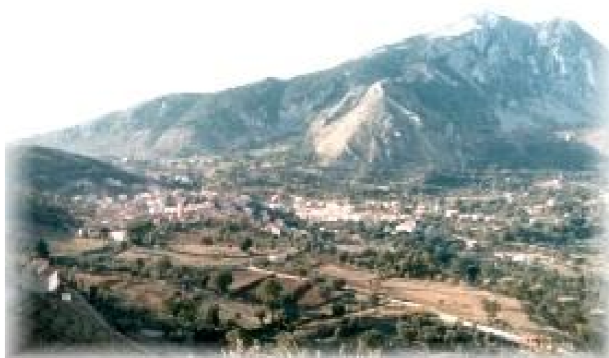
MONTE BULGHERIA (1225 mt)

Изследователят Пероне-Капано пише, че „отчаянието на тези българи“ било толкова голямо от преследванията заради вътрешните войни в Беневенто и Салерно и заради набезите на маврите, че се принудили да поискат убежище при гръцко-италианските монаси.