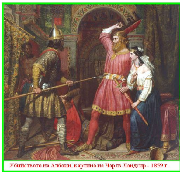
Убийството на Албоин, картина на Чарлз Ландсип - 1859 г.

Съгласно Марий Аваншки (епископ на Авентикум, сега Аванш в Швейцария), настъплението на лангобардите в Италия на 20-21 септември 569 г. За кратко време лангобардите завоюват почти цяла северна и средна Италия, или земите които малко преди това са разорени от войната на Юстиниан с остготите. Във Фриули Албоин основава първото на територията на Италия лангобардско княжество - Фриулското херцогство и назначава за негов управник, племеника си Гизулф. В 569 г. е покорена Верона, Милано и земите до Триент (Триенто в обл.Трентино). Градовете които се съпротивлявали бивали разграбвани, докато доброволно предалите се като Тревизо и Виченца, не се подлагали на насилие. Като цяло лангобардското завладяване е по-