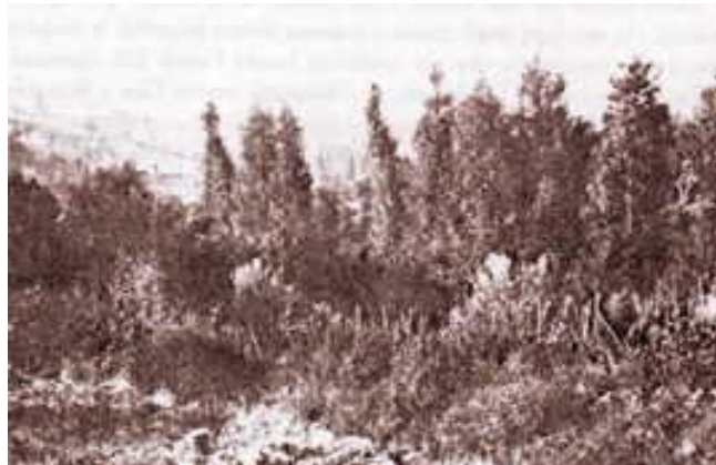
Българската област в Molise. Долината Carapelle.

За разлика от тях, крепостта Тичино, в която има силен византийски гарнизон се приготвя за храбра и упорита защита. Въпреки че източниците не споменават, най-вероятна основната маса войни-защитници са били туранци под византийско командване. И Албоин при обсадата на крепостта използва също туранци (авари и българи)(31). Така че може да се мисли че гъстото присъствие на българи в района на Тичино, не е случайно, а е свързано със стратегическото значение на тази крепост за