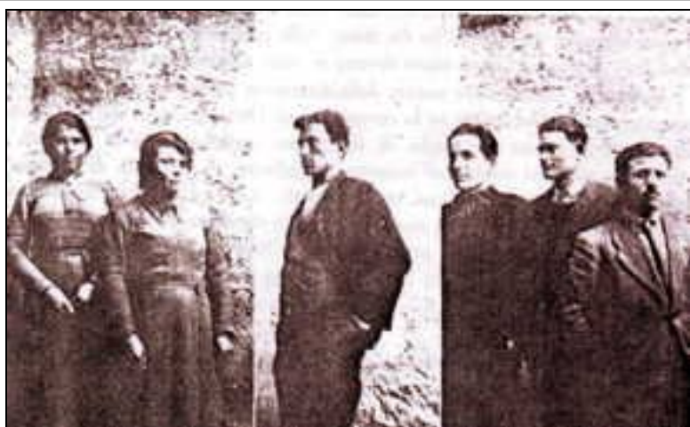
1. Ielsi(Campobasso). Подчертано монголоидни черти на жената вдясно. 2. Турански тип от района на Secondigliano(Napoli). 3. Ielsi. Турански тип

Колкото и да е смекчено във вдлъбнатите и ъгловати части, колкото и да се стреми към ритмичността на арийските линии, монголоидния профил е твърде ясен за да може да се отрича. Монголоидни очи, наклонени и приближени, сплескан нос, изпъкнали скули, лицев прогнатизъм са много разпространени именно в земите, в които историята