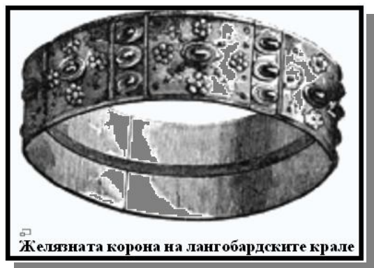
Желязната корона на лангобардските крале

покоряването на Одерцо след победата над Равена, също е използвал аварска помощ. Такива сведения липсват и за крал Лиутпранд (712-744 г.) при завземането на Пентаполиса, както и за крал Айстулф (749-756 г.) при окончателното покоряване на Равена. В своята „История“ П. Дякон съобщава че крал Лиутпранд „с дълбока мъдрост винаги е съумявал да запази мира с франките и аварите“, което показва че последните лангобардски крале са водели политика на извличане на взаимна полза от отношенията и с франки и с авари. Освен това, лангобардските крале винаги са разчитали на българските си съюзници особено при действия в по-труднопроходими области, единствено с изключение на Агилулф, който влиза в конфликт с българите на Варнеканций, убит от него като бунтовник.