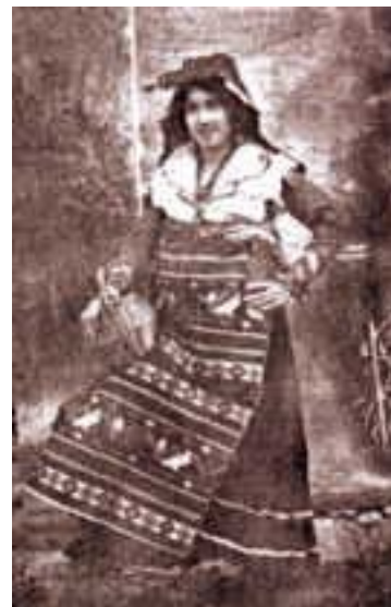
Носия от Cercemaggiore (Campobasso).

Книгата на един унгарски писател, Геза Фехер, не само потвърждава приетите от нас насоки, особено във филологическата област, но ни облекчи и пътя за допълнителни открития(9). Той, продължавайки проучванията на Микола(10), проследява прабългарите при техните различни установявания по Дунава, издирва техните примитивни фортификации, разграничава в унгарския език угро-финските от българските думи, отбелязва за наличие на писменост у българите, преди възприемането на гръцката писменост. (Ж.В. официалните надписи на бълг. канове в езическия период са на гръцки език)