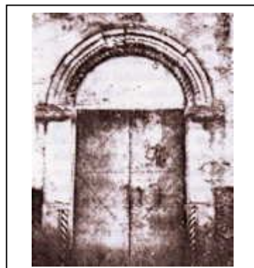
Iesi. Порталът на църквата San Andrea.

Въведените от Обединителния „Едикт на крал Ротари” ограничения оставят отворена врата за толерантност (търпимост) с глава СССХС "низи легем алиам а пиетате ностра меруеринт". Съюзните на лангобардите негермански племена, след завоюването на Италия от Албоин, търсеха земя за заселване и охотно служеха като наемници на наследниците му. Неговите помощници бяха заслужили истински привилегии, признати им по-късно(25).