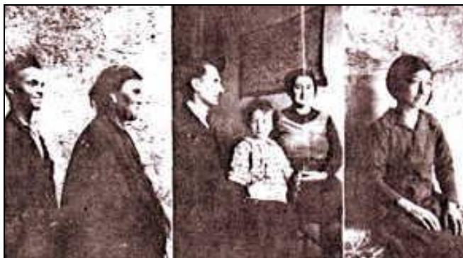
1. Ielsi. Майка и син, турански тип. 2. Съпруг рус dolicocefal 70% лангобардски произход. Bonito(Avelino). Съпруга брюнетка dolicocefal 76% с тип и презиме (Volcari) от старобългарски произход. 3. Riccia(Campobasso). Монголоиден тип на цяла фамилия.

и хипербрахицефалията преобладават на север. На юг преобладава русият цвят и тесни лица, докато на север - тъмните коси и широките и плоски лица. В известен брой хора, въпреки и доста ограничен, се среща монголоидни петна в областта на sacrum'a