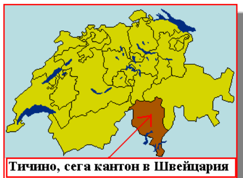
Тичино, сега кантон в Швейцария

Срещат се отделни сведения за това и в „Хрониката от Касино” и тази от Валтурно. В „Табула хорографика М.Аеви” също така е очертана границата на тяхното заселване(3). Всички по-късни историци се спират на думите на Дякон само за да изразят мнения върху правите прерогативи на Алцек и неговите наследници(4).