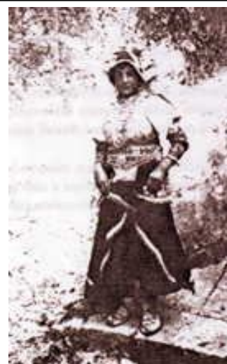
Жена от Letino.

Българите, според Дякон, са се установили за първи път в Италия с лангобардите през 568 година. Някои исторически източници обаче твърдят, че това е станало много по-рано. Те, както вече казахме, са се появили с Атила през 452 година (стара и невярна трактовка). От 504 до 511 години те дебаркират на крайбрежието при Бруцио заедно с гепидите и гърците, когато са посрещнати от воините на Теодорих. Те са били съюзници на готите през 555 година, защото след разгромяването и смъртта на Тея в подножието на Везувий, седем хиляди негови бойци, избягават в Кампса (Конса?) заедно с плячката си, командвани на утургура Раняри(10). (Ж.В. Етимологията на името може да се свърже с авестийското rānu , пехлеви rān , индоарийски (санскрит) ran , rana , raṇati , raṇyati , осет.иронски raḷyn , дигорски iraḷun – радвам се, наслаждавам се. При българите се среща името Ране , Рани , Рано , Ранул , Ранко , при осетинците Роен )