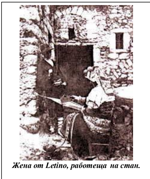
Жена от Letino, работеща на стан.

Но двата братски народа (гепиди и лангобарди) твърде скоро стигат до неразбирателство. То вече е породено, когато претендента Илдеки, около 527 година, победен от Вакон (Вахо), намира убежище при гепидите. Лангобардите предявяват претенции за земите на гепидите в Панония. Стига се до война. Гепидите са окончателно победени със смъртта на цар Гуинимунд (около 551 година). Лангобардите, за да победят, влизат в съюз с аварите, заселени от лявата страна на Дунав(22). Лангобардите първоначално заселват земите между Драва и Сава откъдето, правят своите набези към Далмация и Илирия, чак до Епидамнос (Драч)(23). В резултат на това цялата маса българи включени в земите на гепидите, преминават към