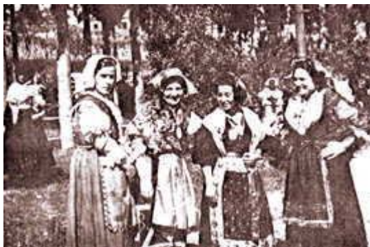
Ielsi u Riccia. Модерно облекло.

Но това, което все едва се наблюдава в Мизия, където българите се заселват след 670-та година, се открива в Панония, където те се срещат още от 400-та година. Тук населяваните от тях земи не получават тяхното име, защото българите са зависими и плащат данъци на многобройни завоеватели като хони-авари, гепиди, лангобарди, унгарци. Но с изключение на религията – разпространението на католицизма и по-късно на калвинизма (в Средновековна Унгария), в долините на Дунав и Тиса, се срещат