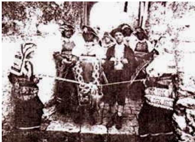
Letino. Сватбен кортеж

В първия си брак Албоин се бе оженил за Клотсуинда (починала в 567 г., дъщеря на Хлотар, цар на франките (Хлотар или Клотар I /555–561 г./, успява за кратко да обедини всички франкски кралства); вероятно поради тези роднински връзки франките не му се противопоставят, въпреки че са в съюз с Империята (Византия). Но той