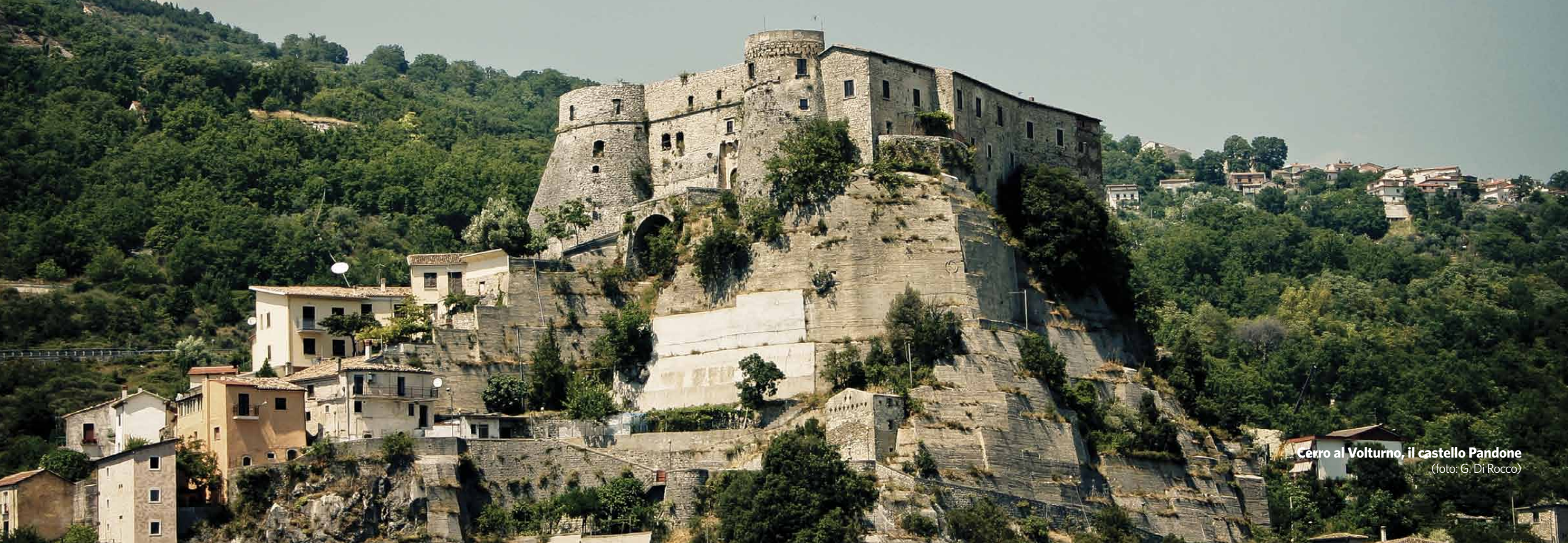
Cerro al Volturno, il castello Pandone

Poco distante da Pizzone, su uno sperone a sud del Rio dell'Omero e a brevissima distanza dalle sorgenti del Volturno e dal cenobio benedettino, si trova Castel San Vincenzo. Perno dell'intero sistema di fortificazioni e borghi murati vulturensi, Castel San Vincenzo nasce dalla fusione di due piccoli insediamenti: Castellone al Volturno e San Vincenzo. È dubbio, ma non improbabile, che il castello in questione sia quello menzionato nel documento n. 92 del Chronicon e datato al 945, con il quale Leone, abate del monastero, concede ad libellum a Lupo, Pietro, Adelberto e Adi le terre del cenobio situate intorno al castello con l'obbligo, tra le altre cose, di risiedere in ipso castello.