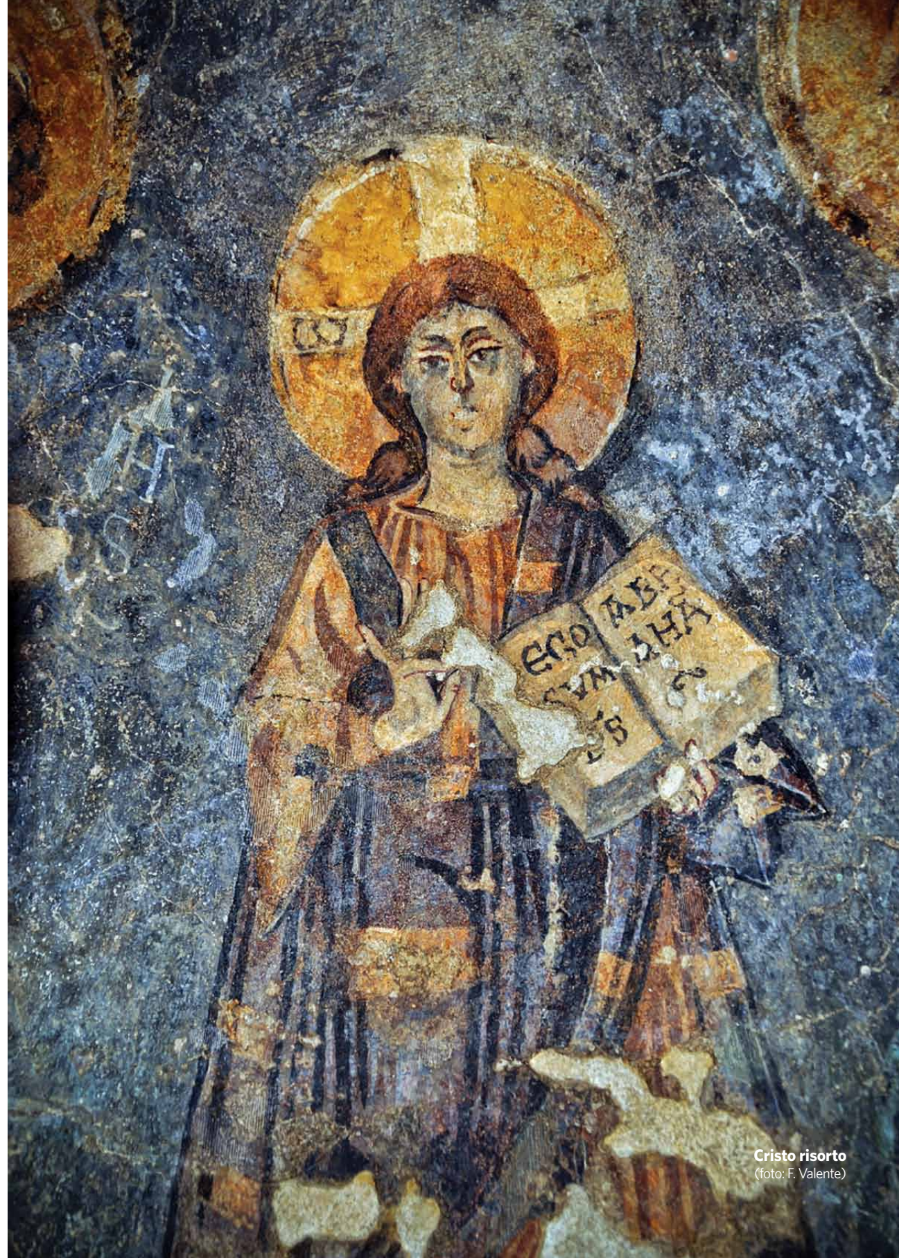
Cristo risorto