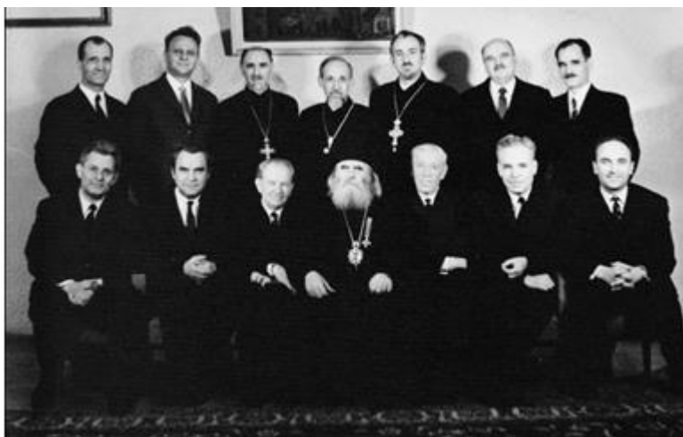
Професорите от Духовната Академия

На 1 ноември 1973 г. бях избран от Академическия съвет за професор.