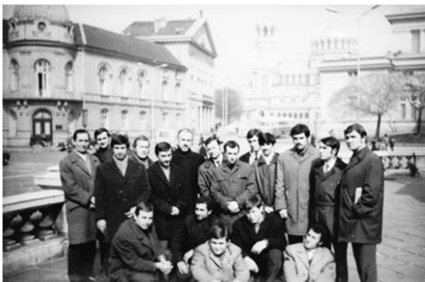
Моят клас от Духовната Академия.