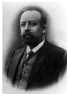
Проф. Любомир Милетич