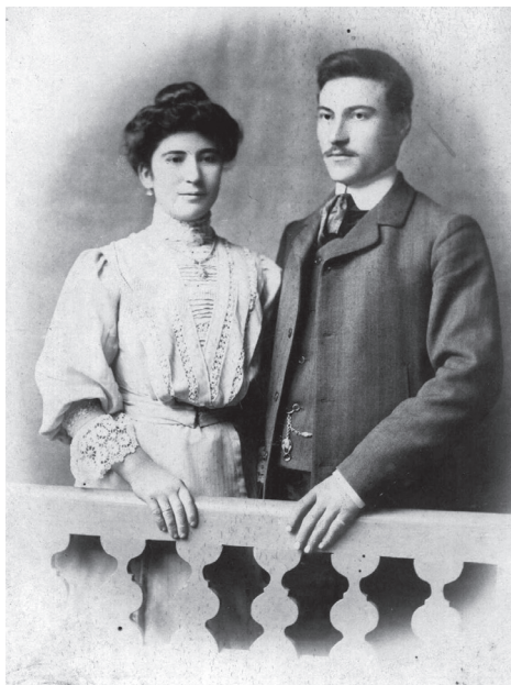
Младоженци - 20-те години на ХХ в.

Хасковската жена не остава назад от западния образец към тоалета да се прибави и чадър. Чадърът намира по-голям прием сред младите жени, които подражават на модните влияния. Почти всяка хасковлийка от буржоазно и интелигентно семейство носи чадър, различен според сезона. Запазени са чудесни образци на чадъри, които са с различни цветовете, с богата украса от ресни и дантели по периферията. Носенето на чадър не е толкова от необходимост, а стремеж към изисканост и интелигентност. Особено в празнични дни чадърът е задължителен към тоалета на всяка една богата дама. За това си спомня един хасковски съвременник от началото на ХХ в., когато описва как се празнува Великден. Обикновено това става на поляните в края на града, където се извиват кръшни хора, разказва той. Едва в по-късни часове, когато слънцето не пече така силно, на празника започват да идват по-тежките и богати фамилии, всички в нови облек-