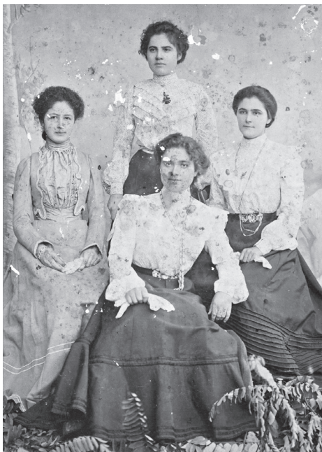
Хасковски млади дами - 1909 г.

урно изрязани. Особено впечатляващ е дамският корсет, той е с много дупки и върви, които се изпъват откъм гърба и стягат тялото на жената, така че коремът да е прибран, а тялото изправено. Когато на пазара започват да се продават тънки и прозрачни чорапи, дълги чак до ханша, хасковските жени с красиви крака не могат да устоят на модата и започват да ходят с открити до коленете, а и малко по-нагоре крака, което събужда любопитството на мъжете. „Увеличиха се мераклиите по улиците, които не се задоволяваха