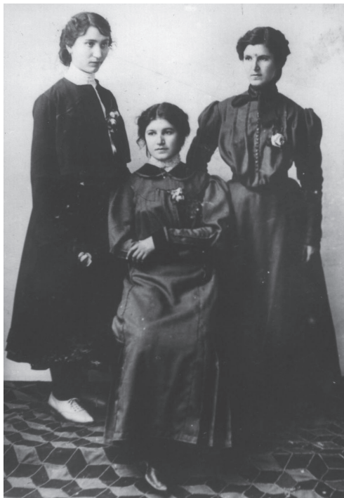
Хасковски дами - 1906 г.

тонове, особено до края на XIX в. След това постепенно започва използването на платове с по-светли тонове. Роклите са цели или се състоят от две части - пола и корсаж, и са с богата драпировка, с много набори и гарнитури от дантели и шевици. Те са дълги до земята, с малък шлейф. На модни приливи и отливи, някои по-трайни, други съвсем за кратко, се преминава през роклите с блузи с балон ръкави и тесни маншети, през най-различни пъстри и кожени колани, силно притискащи и отделящи гърдите от корема,