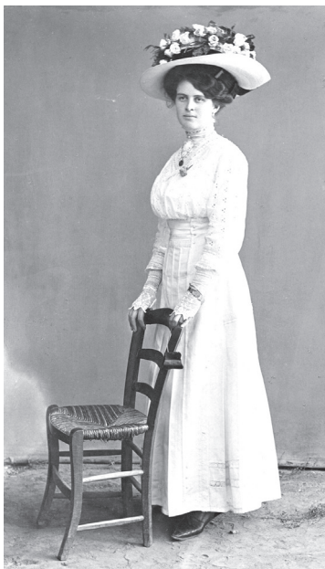
Достолепна хасковска дама - 1910 г.

та на кока е известна като „чока”. Дама с разпуснати дълги коси почти не се среща. Разпуснатите коси не се приемат добре в обществото. За сметка на това наред с кока започват да се носят по-къси фризирани коси, което се практикува най-вече от изисканите дами и интелигенцията. Най-вече това са учителките от първоначалните, прогимназиалните и средните училища. Това не пречи, пише един съвременник, да бъдат строги и взискателни към своите възпитанички и да искат от тях да носят дълги коси. „Дълги или къси коси - това е въпрос на вкус, които се менят. Обаче възпитателката не може и не бива да иска от своите питомци да правят това, което тя не прави. Ние мислим, че само учителката с дълги и неподстригани коси може да настоява ученичките ѝ да не се подстригват“. 8