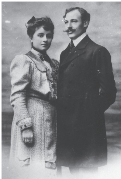
Годеници - 1905 г.

се и натруфила, минава из улицата? Нима тя с удоволствие не констатира как всеки мъж втречено измерва оголените ѝ крака до над коленете, обути в тънък прозрачен чорап? Нима не изпитва самодоволство, когато види погледа да се хлъзга върху съвсем голите и ръце ѝ след това обърне шията ѝ, гола чак до гърдите? И тъкмо така оголилата се жена ще има повече обожатели и повече успех в любовта... В нейната голота и флирт мъжът чете повече залог и гаранция за задоволяване на своите желания.“ Накрая авторът, робувайки на консервативните си позиции, призовава