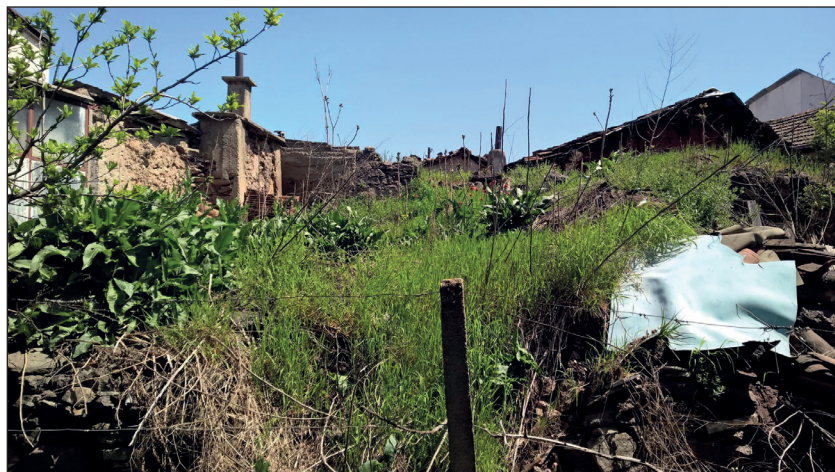
Основите на къщата и яхъра на Доне Тошев в махала Тузлия. Щип, 2015