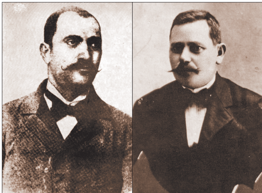
Йордан Гавазов. Кюстендил, 1898