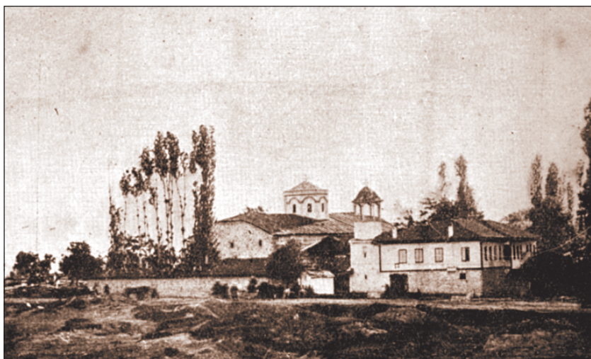
Храм „Св. Неделя“, Битоля, началото на XX в.