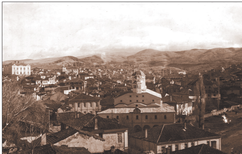
Щип, началото на XX в.